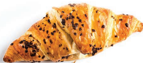
ФРАНЦУЗСКАЯ ВЫПЕЧКА FRENCH PASTRY