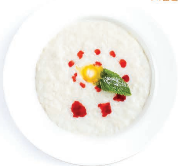
КАША РИСОВАЯ RICE PORRIDGE