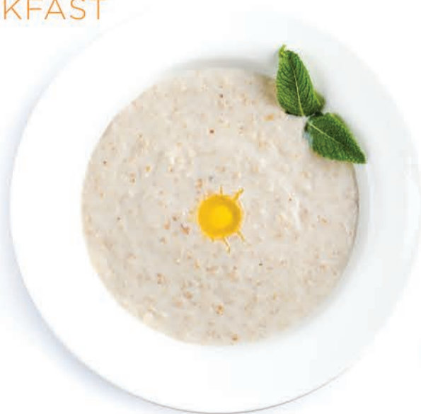
КАША ОВСЯНАЯ OATMEAL PORRIDGE