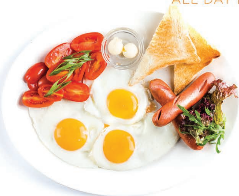
ГЛАЗУНЬЯ/ОМЛЕТ/СКРЭМБЛ FRIED EGGS/OMELETTE/ SCRAMBLED EGGS