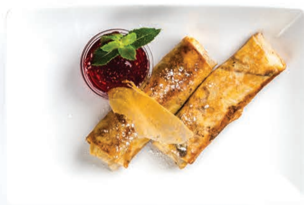
БЛИНЧИКИ С ТВОРОГОМ (2 ШТ) BLINTZES WITH COTTAGE CHEESE (2 PCS) БЛИНЧИКИ С МЯСОМ (2 ШТ) BLINTZES WITH MEAT (2 PCS)