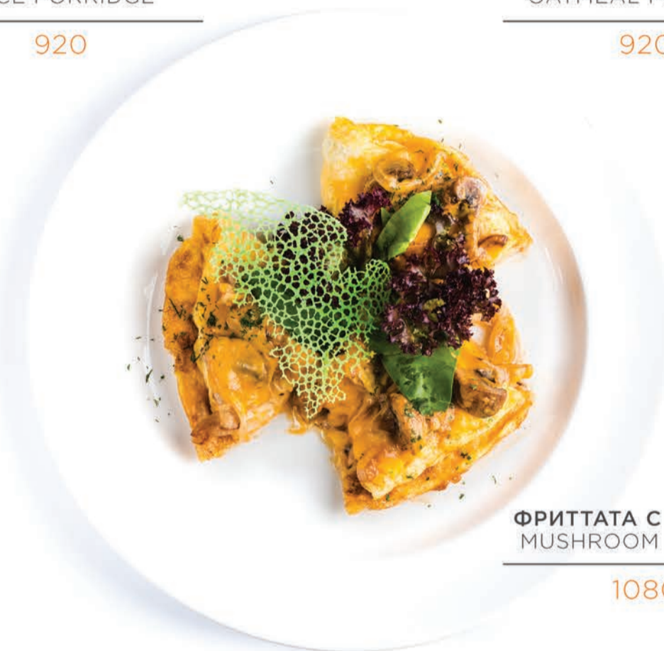
ФРИТТАТА С ГРИБАМИ MUSHROOM FRITTATA