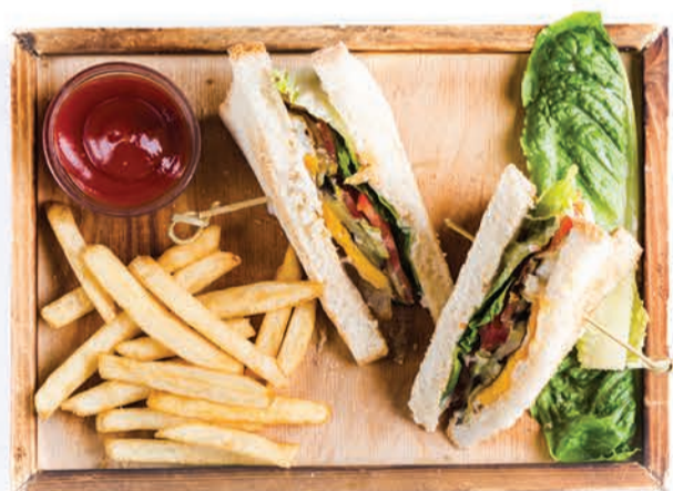
СЭНДВИЧ С ОВОЩАМИ И ЯЙЦОМ VEGGIE AND EGG SANDWICH