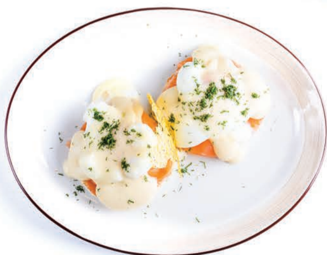
ЯЙЦО ПАШОТ С ЛОСОСЕМ POACHED EGG WITH SALMON