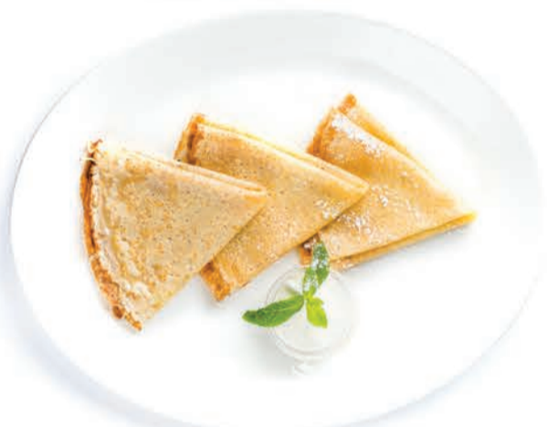
БЛИНЧИКИ (3 ШТ) СО СМЕТАНОЙ/С ДЖЕМОМ/С МЕДОМ BLINTZES (3 PCS) WITH SOUR CREAM/JAM/HONEY